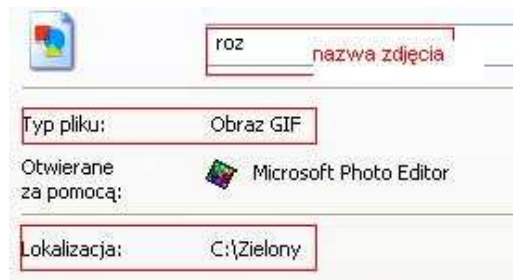
Rys.1. Fragment okna Właściwości pliku.

Uwaga: do warstwy proszę dołączyć zdjęcia w formacie .gif lub .tif – nie będzie wówczas problemów wyświetleniem zdjęcia w programie.